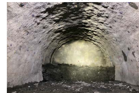
26.羊蹄トンネル(有島)他 シールドマシン完成状況